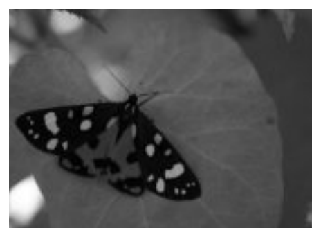
Der Schönbär Callimorpha dominula: Die von LNU und Offenland Stiftung gepflegten Gebiete sind geeignete Lebensräume für diese prachtvollen Nachtfalter.

Das artenreiche Offenland ist jedoch bedroht: Veränderte Flächennutzung und landwirtschaftliche Praktiken, Urbanisierung und Bodenversiegelung sind Gründe, die zu einer Verringerung geeigneter Lebensräume für Tier- und Pflanzenarten führen. Zudem muss auch eine ausreichende