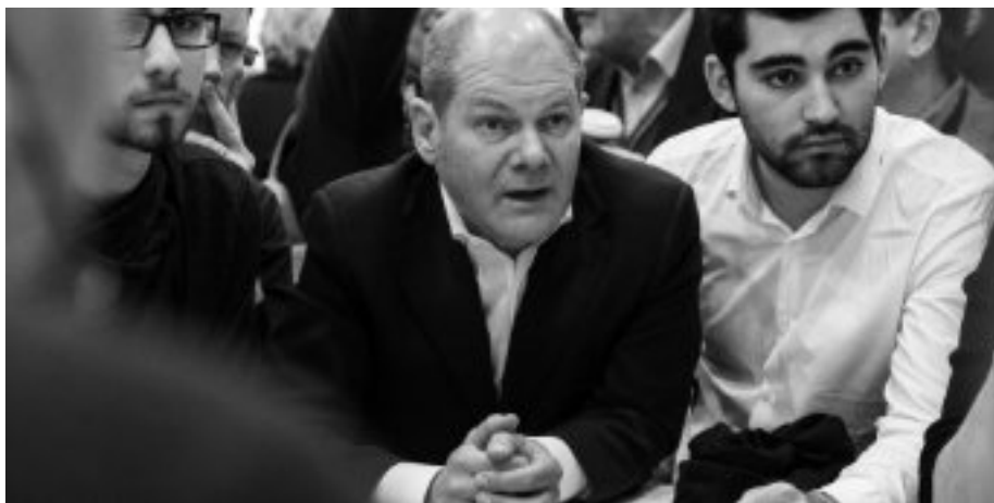
Kanzler im Diskurs. Olaf Scholz ist seit Dezember der neunte Kanzler der Bundesrepublik.

Der Anspruch ist mutig – und zeitgemäß. Die Klimakatastrophe, Corona-Pandemie, der Rückstand in den Bereichen Digitalisierung, gesellschaftliche Beteiligung, Migration oder auch in der industriellen Erneuerung unserer Wirtschaft fordern mehr als „Verwaltung“ oder die Hoffnung darauf, dass „der Markt“ es schon richten wird. Da zeigen sich auch die natürlichen Spannungen in der Koalition: Wo können Impulse das Marktgeschehen motivieren, wo muss die Gesellschaft, muss der Staat stärker gestalten? Wie steht es um das